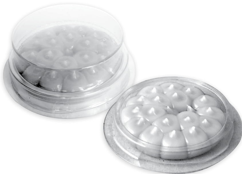
Tacka 小島 Bird Free z pokrywą i bez