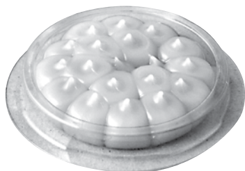
Gotowa do użycia tacka z 小島 Bird Free

Bird Free dostarczany jest na 15 gotowych do użycia tackach umieszczonych w kartonowym pudełku.